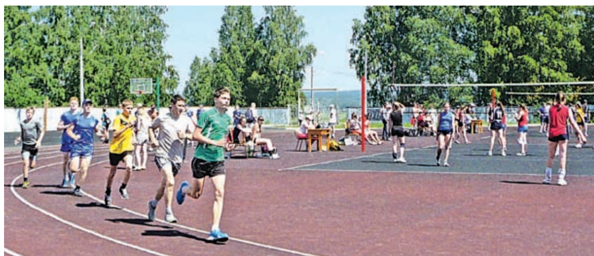
■ В этот день сложились все составляющие, и праздник удался. Соревнования спартакиады проходили по 10 видам спорта

Победителям вручили футболки, бейсболки, спортивный инвентарь, сладости – всего 150 призов. При спонсорской поддержке администрации города и банка «Кедр» в партнерстве с «Бинбанком».