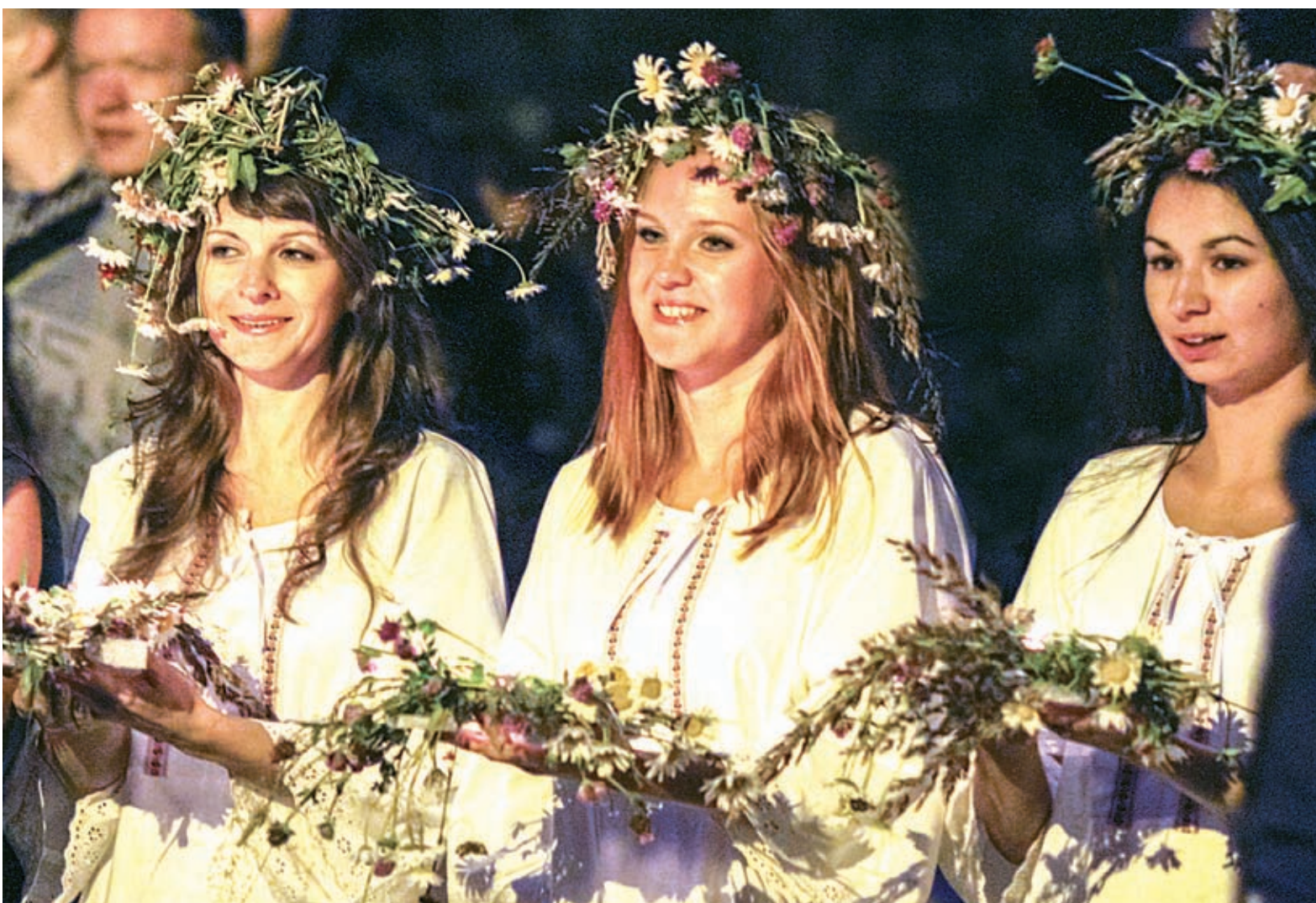
■ День Ивана Купалы возрождает и сохраняет лучшие традиции славянского народа, развивая тему любви, семьи, красоты, природы.

В ночь с 6 на 7 июля в Лесосибирске состоялся праздник, получивший название «Сказы Святобора»