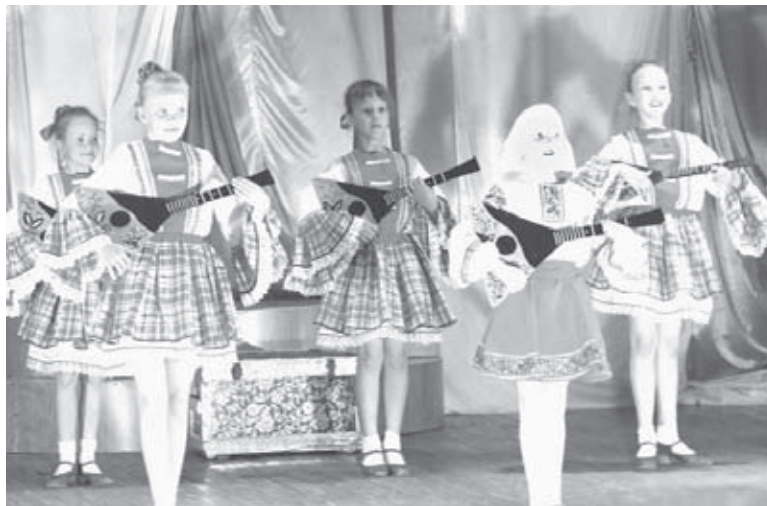
■ Выступления участников концерта были яркими и запоминающимися

В Дом культуры были приглашены почетные гости и обладатели сертификатов на бесплатное посещение концертов, да и тех, кто купил билеты на вахте, было предостаточно. Слава организатора интересных концертов, программ и фестивалей уже укрепилась за Маклаковским домом культуры достаточно прочно, и в день закрытия творческого сезона его зрительный зал был полон.